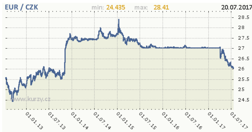
Vývoj kurzu české koruny k Euro za posledních 5 let. Zdroj dat: kurzy.cz

Náklady dopravců v mezinárodní kamionové dopravě ve 2. čtvrtletí klesly dle jednotlivých tras o 2 – 3%. Důvodem je především pokles cen pohonných hmot (o cca 5%) a posilování české koruny po ukončení intervencí ČNB. Tento trend bude pravděpodobně pokračovat i v dalším období. Nákladů dopravců se v podstatě nijak nedotkla inflace, která byla v měsících (meziměsíčně) dubnu a červnu nulová, v květnu pak dosáhla hodnoty 0,2%.